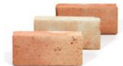
Ladrillo manual 4 x 12 x 24 cm